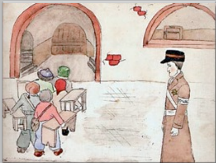
“Le lezioni dei bambini” 1942