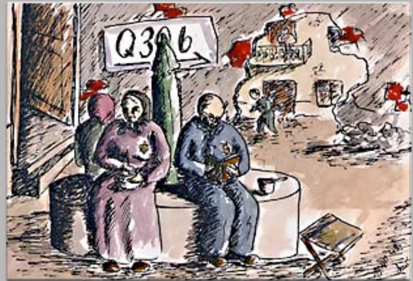
“Nel cortile” 1943