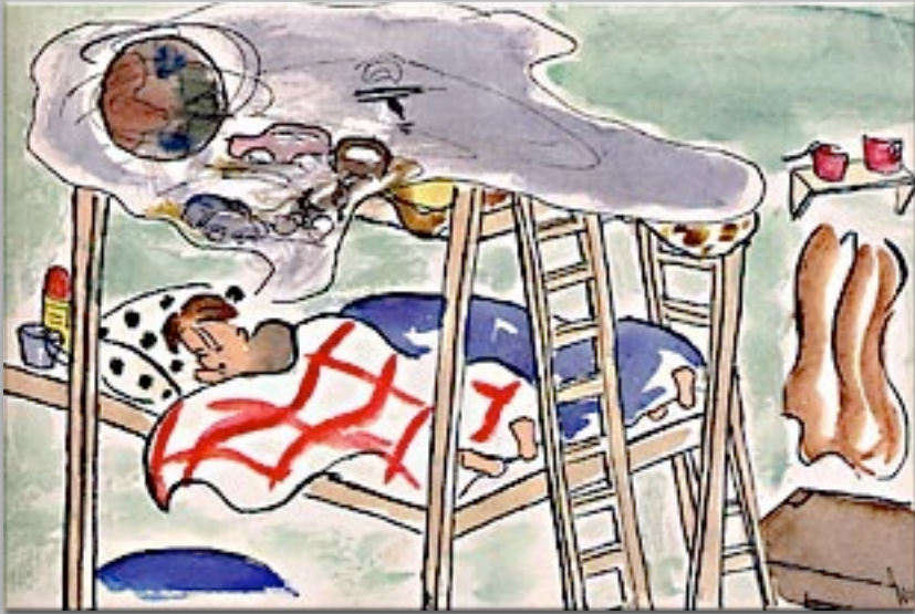
“Il sogno” 1943