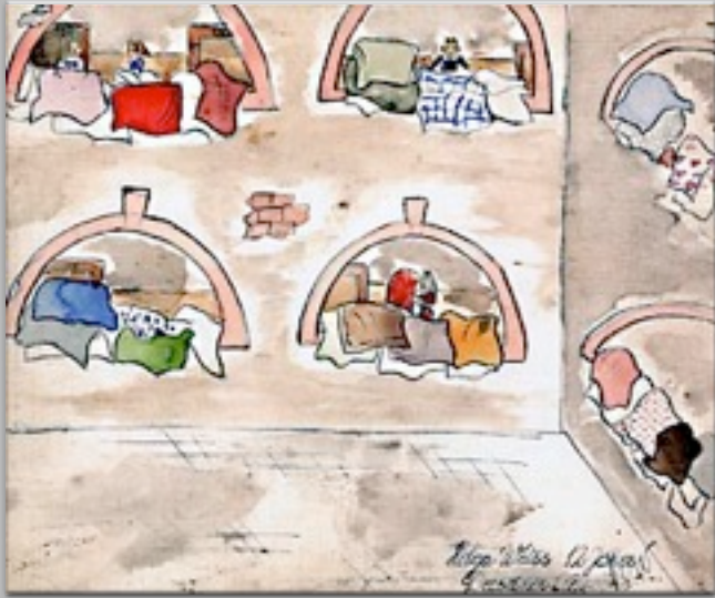
“Le coperte vengono arieggiate” 1942