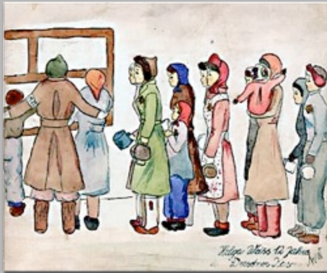
“La fila davanti alla cucina” 1942