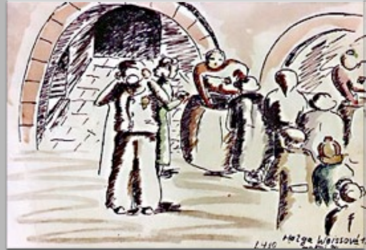
“La distribuzione del cibo nel cortile” 1942