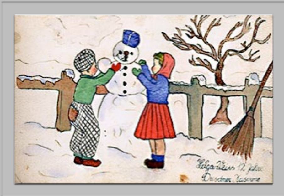
“Pupazzo di neve” 1941