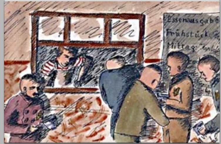
“La distribuzione del cibo nelle baracche degli uomini” 1943