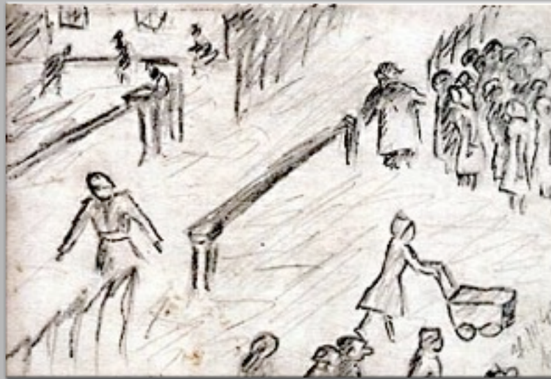
“La strada ariana” 1943