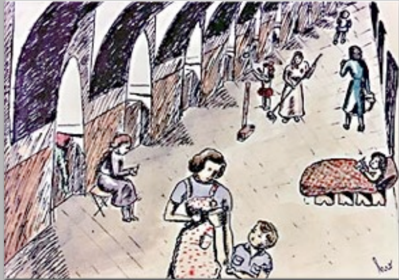
“Il corridoio nelle baracche di Dresda” 1942