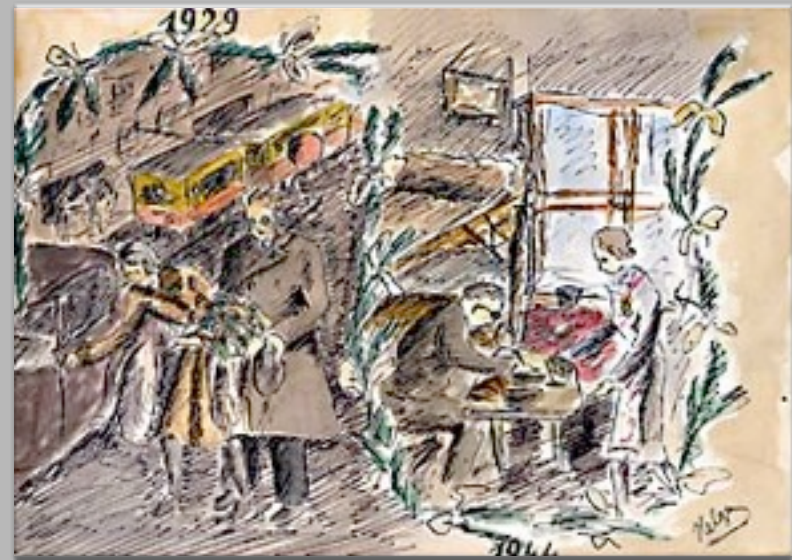
“L'anniversario di matrimonio dei miei Genitori” 1944