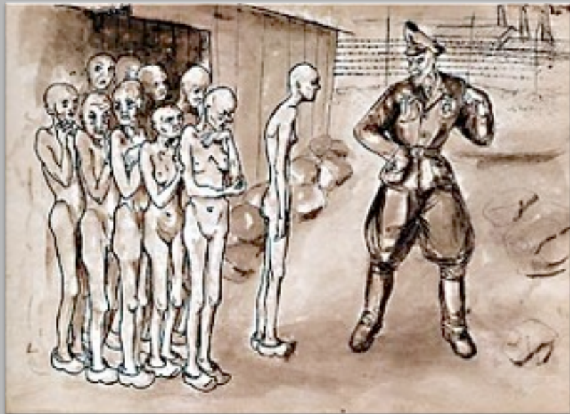
“La selezione” 1945-46