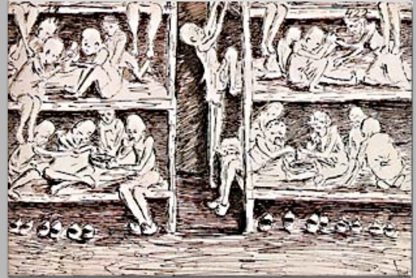
“Le baracche di Auschwitz” 1945-46