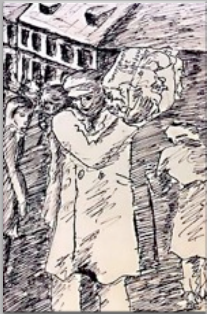
“Il pacco” 1944