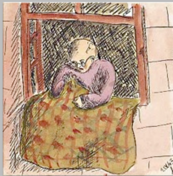
“La caccia alle pulci” 1942