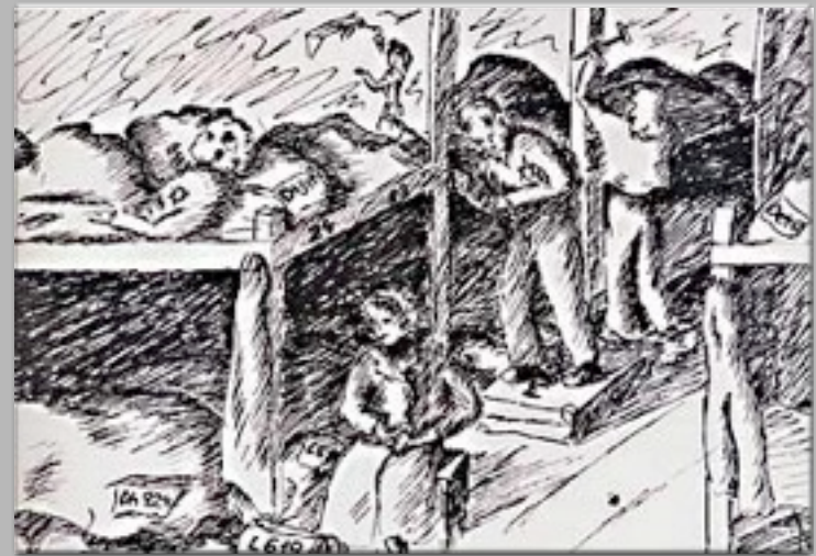
“L'abbattimento dei letti” 1944