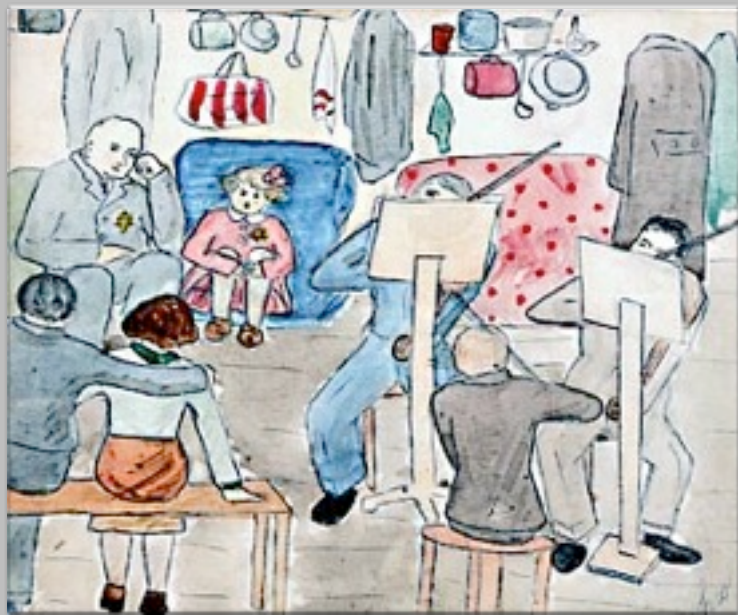
“Concerto nel dormitorio” 1942