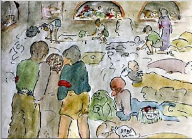
“La chiusa nel cortile” 1943