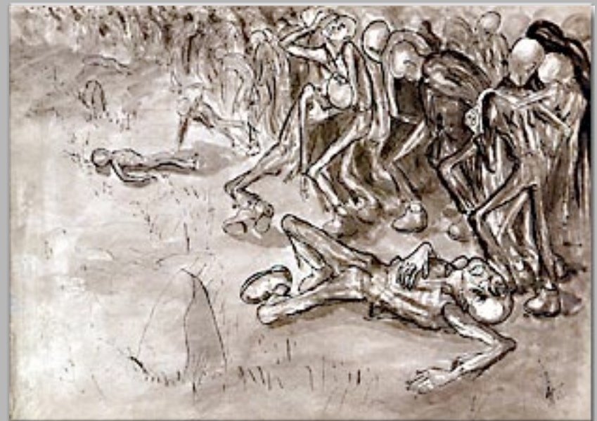
“La marcia della morte” 1945-46