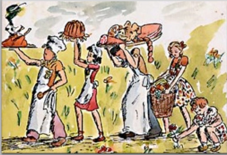
“Il biglietto di auguri” 1943