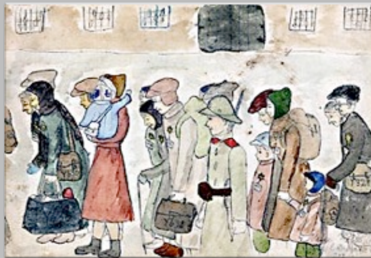
“Arrivo a Terezin” 1942