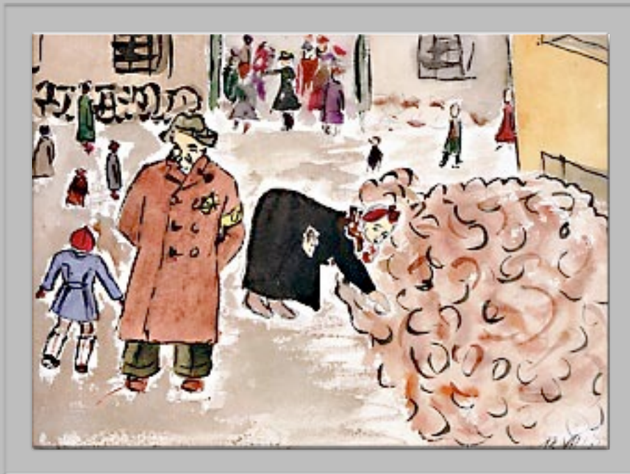
“Rovistare nell'immondizia” 1942