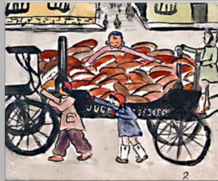
“Pane sui carri funebri” 1942