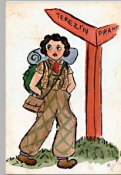
“Il desiderio per il mio compleanno” 1943