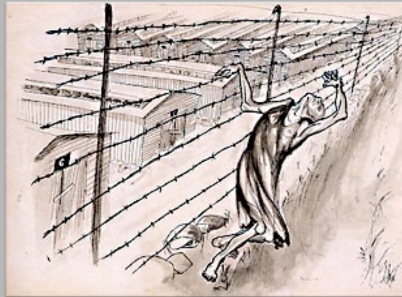
“Suicidio sul filo spinato” 1945-46