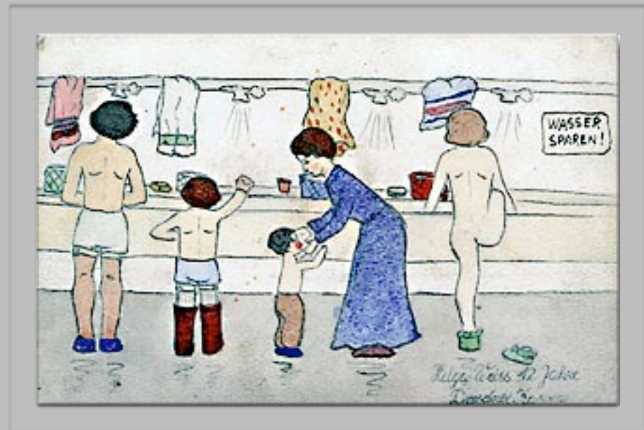
“I lavatoi” 1942