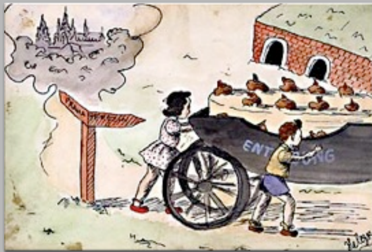
“Il desiderio per il mio compleanno” 1943