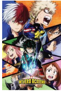
My Hero Academia